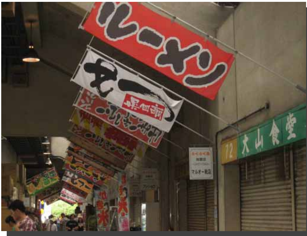
うわさの「ルーメン」